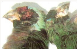
Fig. 10 -11 Sarna do bico em exóticos crostas branco-amareladas ao nível do bico e dos olhos.