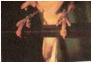
Fig.4 VARIOLA lesões ao nível das patas