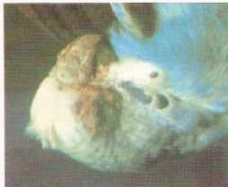
Fig.9 Sarna da cabeça num periquito ondulado, com crostas espessas e amareladas na zona do bico e dos olhos

Sinal de carencia de vitamine E e/ou de ingestão de gorduras rancificadas