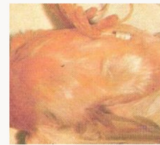
Fig.8 Patas avermelhadas e inchadas

Sinal de carencia de vitamine E e/ou de ingestão de gorduras rancificadas