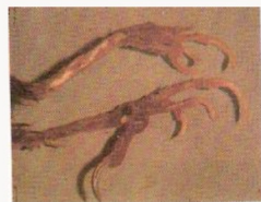
Fig.12 Sarna nas patas dos canários