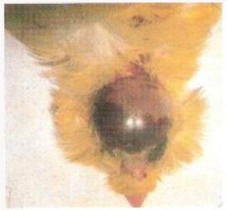
Fig.7 Hemorragia craniana